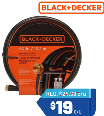
MANGUERA BLACK & DECKER 5/8" X 50FT Medium duty • Ref. A2292 Cantidad: 30