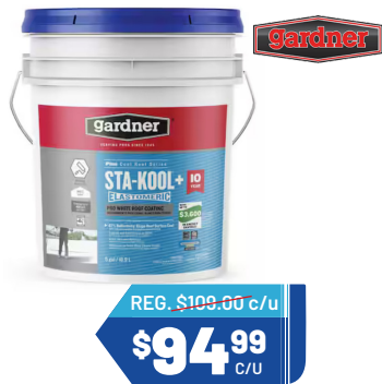
GARDNER STA-KOOL 10 años de garantía Paila de 5 galones Ref: 0063198 • Disponible: 36