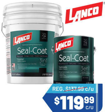
COMBO SEAL COAT Acabado eggshell y flat 1 Paila + 1 galón Cantidad: 20