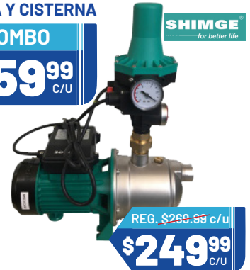
BOMBA DE AGUA SHIMGE Ref. 06166 Cantidad: 6