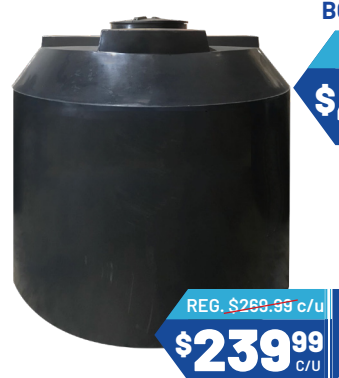
CISTERNA DE 250 GALONES Ref. 13279 Cantidad: 6