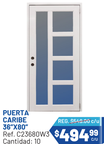
PUERTA CARIBE 36"X80" Ref. C23680W3 Cantidad: 10