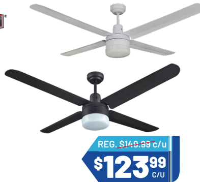
ABANICO DE TECHO 56" Color: Blanco o bronce Ref. 26009WH, ORB Cantidad: 10