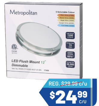
LAMPARA LED DE TECHO 12" Ref. 17489 Cantidad: 24

COMBO •Set Vanity 3 pzs. •Mezcladora •Inodoro One-Piece Cantidad: 5