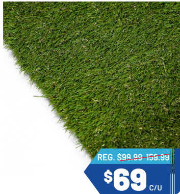
VARIEDAD DE GRAMA ARTIFICIAL 6' X 7.5' Ref. 6029, 6029A, 6029C Cantidad: 20